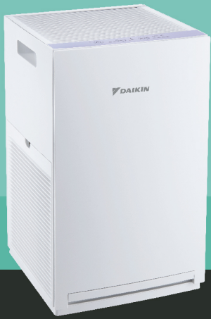
MCQ30ZVM7-A (Blue Colour)