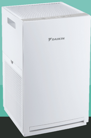
MCQ30ZVM7-H (Grey Colour)